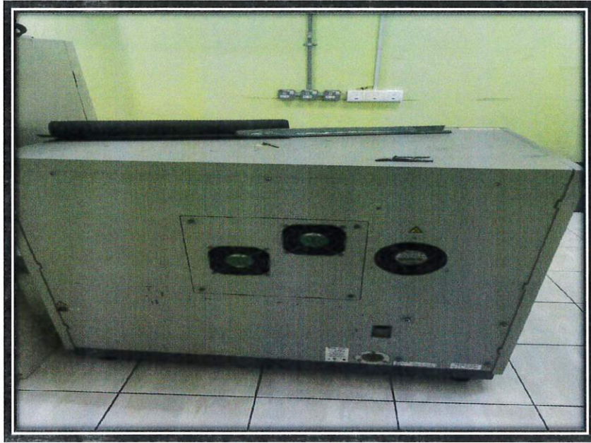
Gambar belakang aset