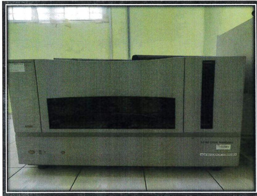
Gambar hadapan aset