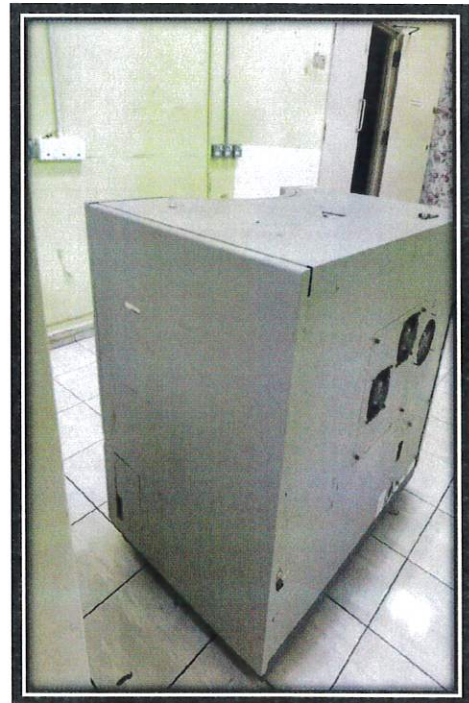
Gambar sisi kanan aset