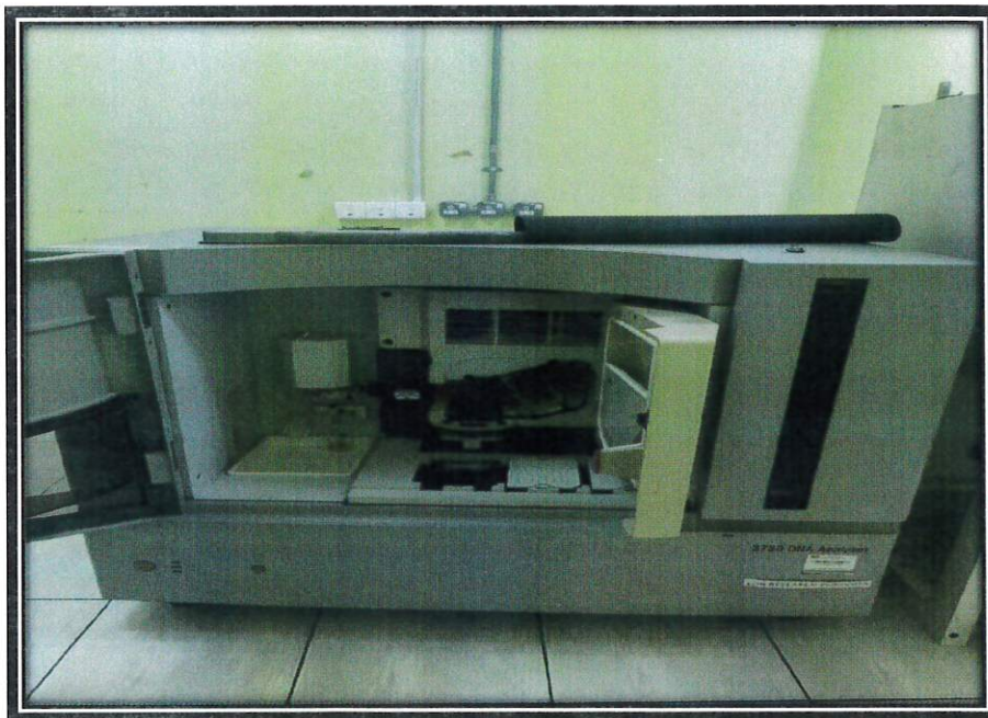
Gambar dalam aset